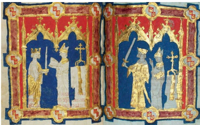
Fig. 6. Libro de la Coronación (Escorial, &.III.3, fols. 31v-32r). Alfonso XI toma la espada del altar y la esgrime

No obstante, la comparación con los testimonios franceses resulta ilustrativa en más de un aspecto y ayuda a acotar el sentido preciso de la intervención apostólica en la investidura caballeresca. Como se indicó antes, el ritual de la traditio gladii quedaba difuminado casi por completo en las imágenes del Libro de la Coronación para evitar cualquier asociación entre poder religioso y soberanía regia. Pero el que Alfonso XI tomase la espada por su propia mano en Compostela habría reafirmado que su poder no venía dado por la Iglesia, ni tan siquiera por el apóstol Santiago, cuyo papel se habría limitado a la pescozada que sellaba la entrada del rey en la hermandad caballeresca y hacía explícito el “deudo” entre monarca y santo patrón. En realidad, los soberanos castellanos ya tenían muy presente dicho deudo –consecuencia de