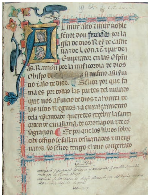
Fig. 5. Libro de la Coronación (Escorial, &III.3, fol. 1r).