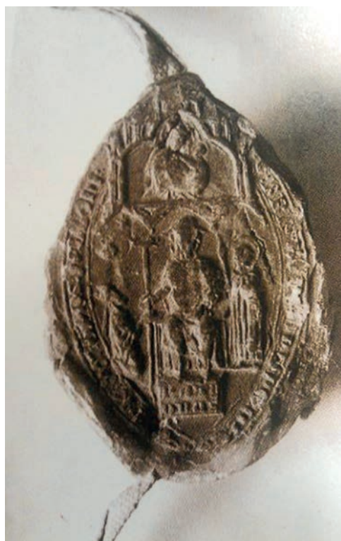
Fig. 7. Segundo sello de D. Berenguel. Archivo de la Catedral de Salamanca (tomado de Santiago, camino de Europa, p. 436)

Pero el gesto de la pescozada por sí solo difícilmente habría podido ser interpretado como una manifestación del origen divino del poder regio puesto que la intervención de la “imagen de Sanctiago” se habría limitado a sancionar la entrada del monarca en un nuevo ordo , el de caballería, a diferencia de lo que se constata en el caso del sello de don Berenguel, en el que se habría ofrecido tanto un traspaso del ritual de la traditio gladii en clave episcopal como de una evocación del tema iconográfico de la traditio legis , en el que se fundamenta la autoridad apostólica por delegación de Cristo 76 . Para aclarar este punto, es preciso llamar una vez más la atención sobre un aspecto del ceremonial —la pescozada— llamado a tener continuidad en otros ordines peninsulares, como en el redactado para Pedro el Ceremonioso que acabó por ser encuadrado con el manuscrito castellano en el escurialense &.III.3 (fol. 44r). La inicial historiada que fue dibujada para ilustrar este pasaje cobija dos escenas diferenciadas: arriba tiene lugar la bendición de la espada sobre el altar —oficiada por tres obispos—; y abajo, el rey, espada en mano, se da él mismo la pescozada (Fig. 8) 77 . Precisamente, el interés del monarca aragonés en este pequeño detalle puede darnos la clave para acabar de aquilatar en sentido de la ceremonia en Compostela.