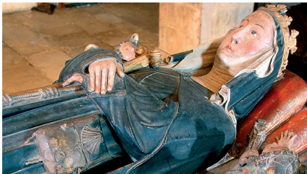
Fig. 1. Maestro Pero. Túmulo de Isabel de Portugal en Santa Clara-a-Nova, Coimbra

Sin duda, la visita regia habría tenido un cariz particular tanto para el cabildo compostelano como para la soberana portuguesa y, en consecuencia, habría sido preparada con meses de antelación por ambas partes, como deja ver la delicada factura del báculo entregado a Isabel de Portugal. Pero el testimonio irrefutable de la existencia de estrechos contactos entre la corte vecina y el arzobispo don Berenguel lo proporciona un conjunto de la Anunciación, en el que se aprecia la preñez de la Virgen, hoy conservado en el museo de la catedral compostelana (Fig. 2). Ya en 1981, Manuel Núñez reconoció en él una obra conimbricense, suposición que ha sido confirmada por otros autores como Carla Varela Fernandes, quien incluye el conjunto en la nómina de obras relacionables con el Maestro Pero y su taller 17 . Aunque no se haga re-