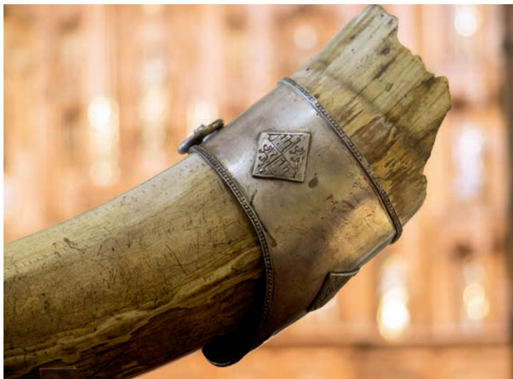
Fig. 9. Olifante de Alfonso XI. Museo de la Catedral de Santiago

El contraste entre la entrega del olifante por parte de un monarca guerrero cuyas hazañas habrían de compararse con las de Roldán y la ofrenda al apóstol de la mejor de sus coronas a cargo de la reina Isabel de Portugal es casi tan acusado como el que se advierte entre la pescozada dada por “la imagen de Santiago” al rey y la solemne traditio baculi escenificada por don Berenguel de Landoria con motivo de la vista de la rainha santa . Pero esta oposición lo es sólo en apariencia, puesto que si algo demuestra el análisis de estos dos eventos es la inagotable riqueza y versatilidad del imaginario jacobeo y su capacidad para mediar entre cálculo político y devoción familiar, entre lo local y lo global, entre tiempos y espacios.