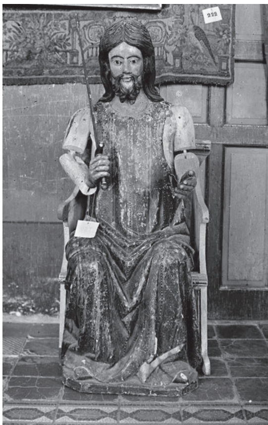
Fig. 4. Santiago del Espaldarazo. Monasterio de Las Huelgas de Burgos

De hecho, la prueba irrefutable de que estas ceremonias venían fraguándose desde largo tiempo atrás la proporciona el Libro de la Coronación (Escorial, &.III.3; Fig. 5), redactado por Raymond II Ebrard, obispo de Coimbra, con el fin de que el monarca recibiese en condiciones